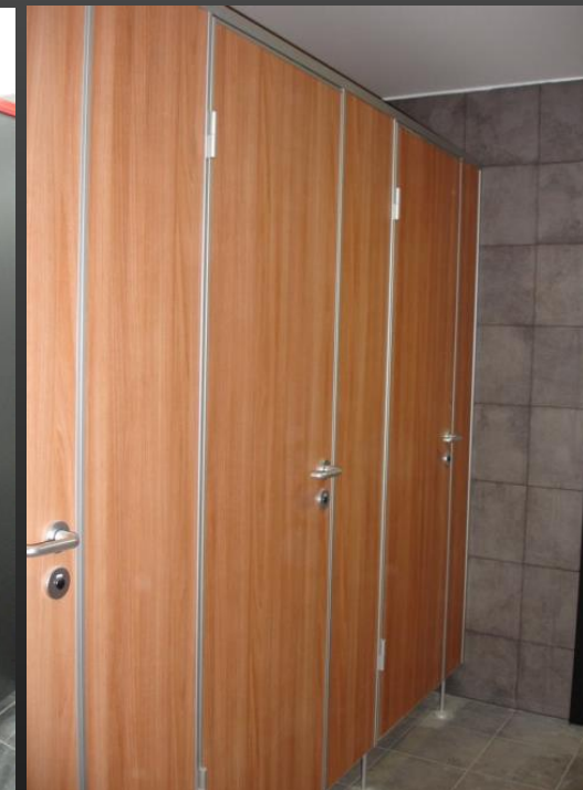
kabiny laminodeska dřevodekor