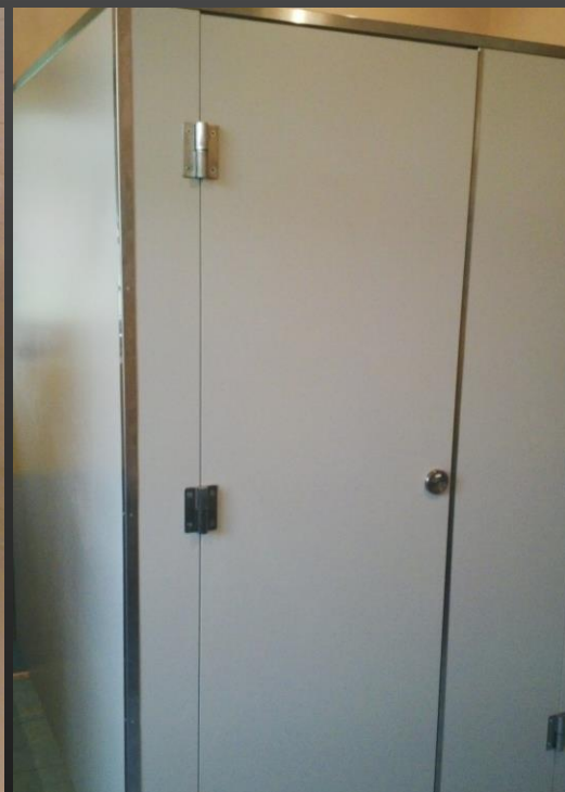
kompaktní deska v nerez provedení