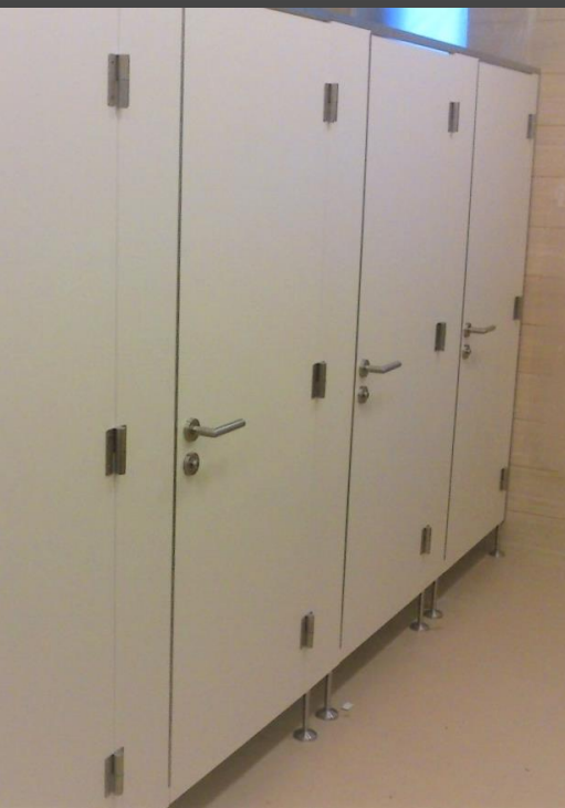
laminodeska s nerez konstrukcí