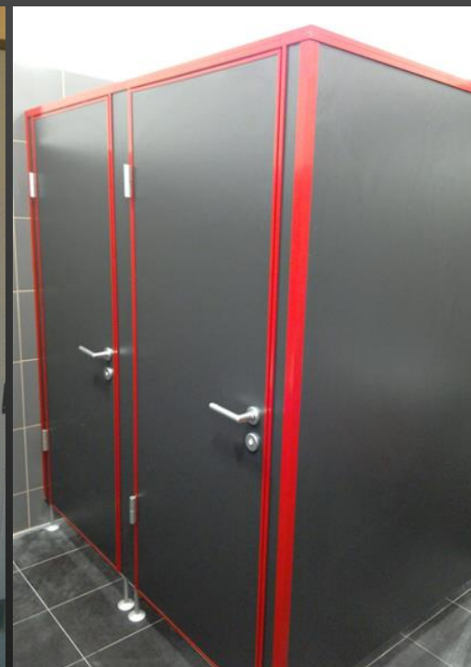
laminodeska s lakovanými profily